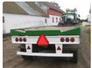
En halmtransportvogn er bedst, hvis ladet hælder mod midten.