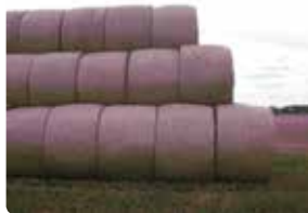
Sikker stabling i forbandt.