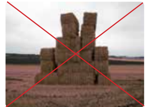
Minibigballer i mark. De øverste kan vælte ned.