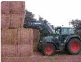
Bigballer i markstak er placeret i forbandt.