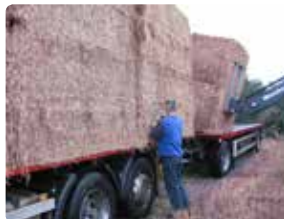
Læsning afsluttes med fastspænding.