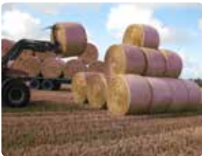
Rundballer stables sikkert på mark.