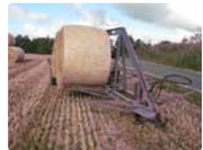
Rundballer hældes mod rækværk i midten.